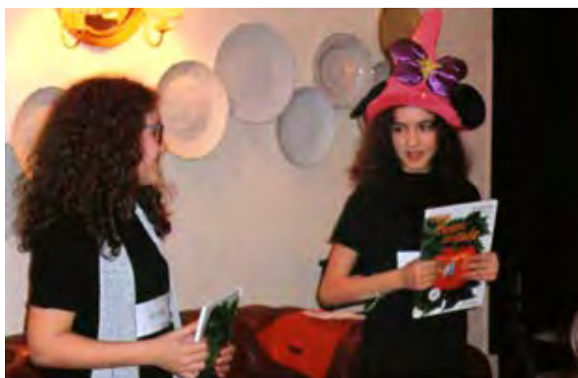
Uma história juvenil contada por jovens...