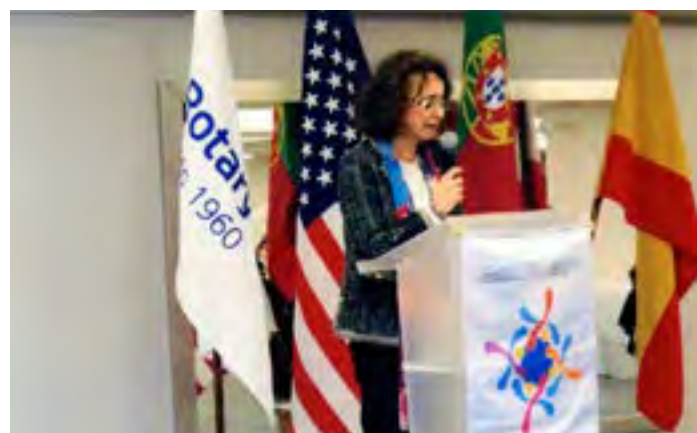
A Gov. Ana Puerto (D. 2201) fala em nome dos Governadores Espanhois.