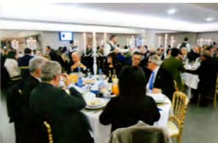
Outro ângulo da enorme sala de jantar.