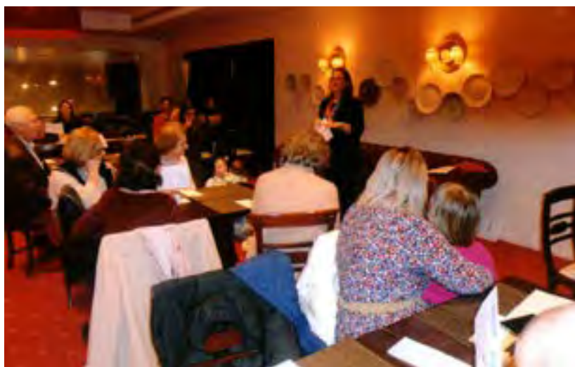
A Presidente da "Casa da Amizade" introduz a programação do evento