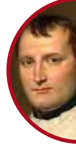
Johann Wolfgang von Goethe (1749-1832)

"O desastre pode resultar duma simples oportunidade perdida."