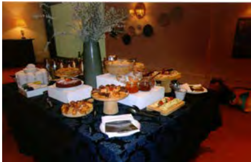
A mesa do "Lanche"

De permeio com as várias presenças de Companheiros Rotários, Senhoras e amigos, muitas foram também as crianças que compareceram e se maravilharam com os ... contadores de histórias.