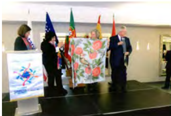
Artísticos presentes para o Casal Presidencial.