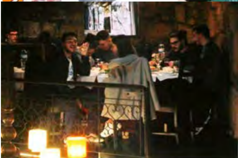
Dois aspectos duma festa de bom companheirismo e solidário.