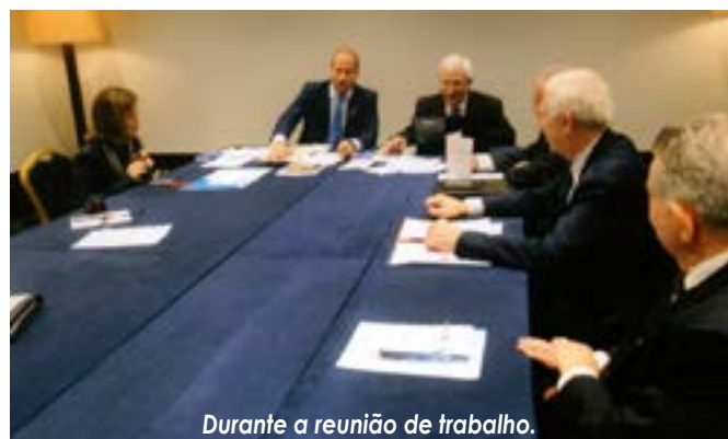
Durante a reunião de trabalho.