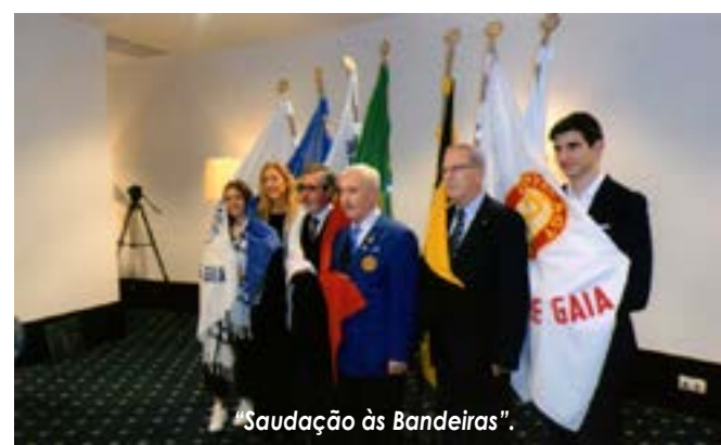
"Saudação às Bandeiras".