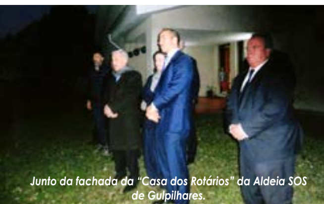
Junto da fachada da "Casa dos Rotários" da Aldeia SOS de Gulpilhares.