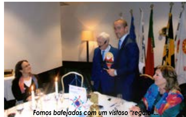
Fomos bafejados com um vistoso “regalo”...