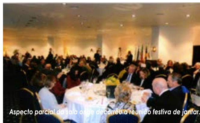
Aspecto parcial da sala onde decorreu a reunião festiva de jantar.