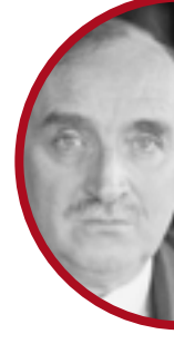
Konrad Adenauer (1876-1967)

"A ordem é o prazer da razão; mas a desordem é a delícia da imaginação."