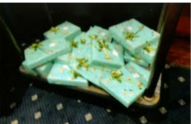
Vivam os presentes!!!