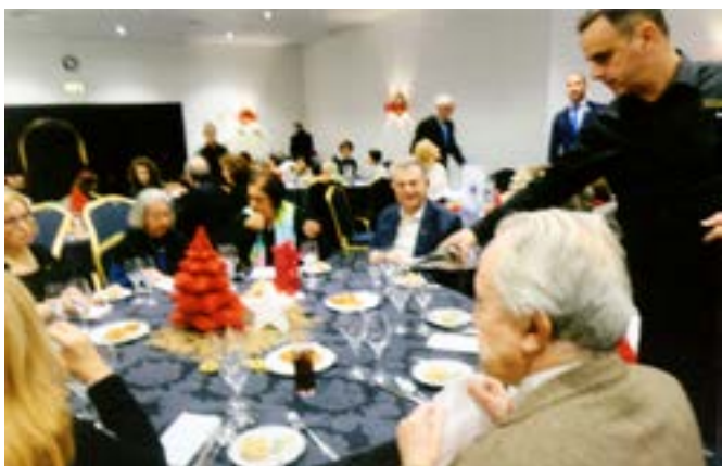
... e outra.