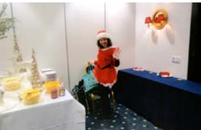
E chegou a "Mãe-Natal"!