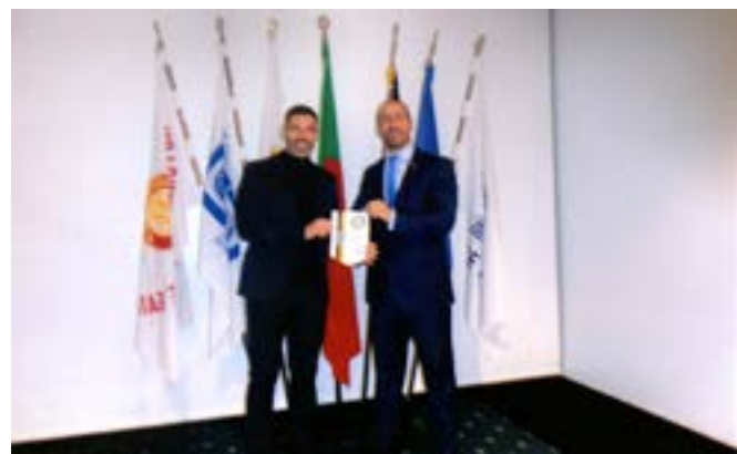
Na simbólica entrega de novos equipamentos à Aldeia de Crianças SOS.