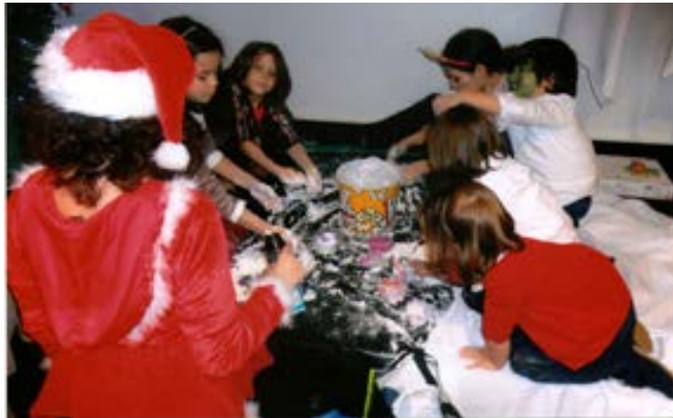
Até neve as crianças fabricaram!