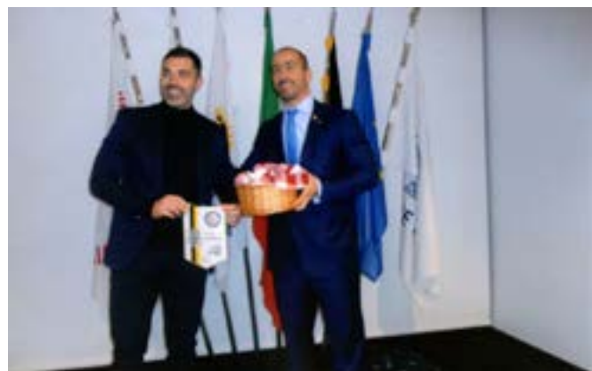
A saborosa oferta da Aldeia.