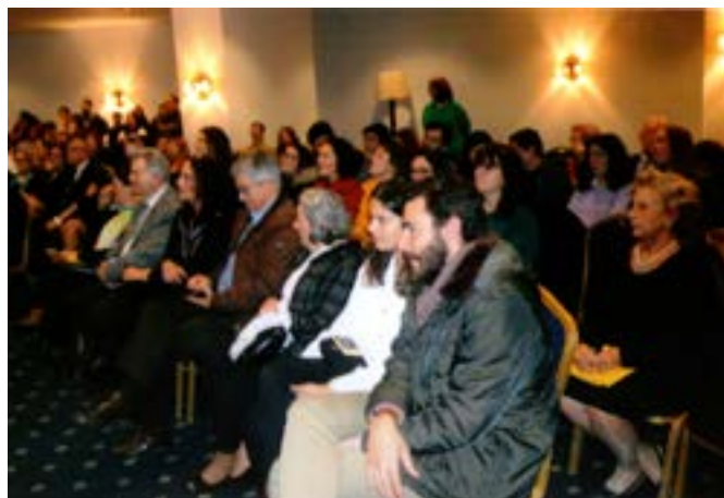
Um aspecto parcial da assistência.