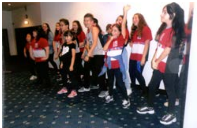
As danças interpretadas superiormente pelos jovens do Grupo de Danças do DSCC.