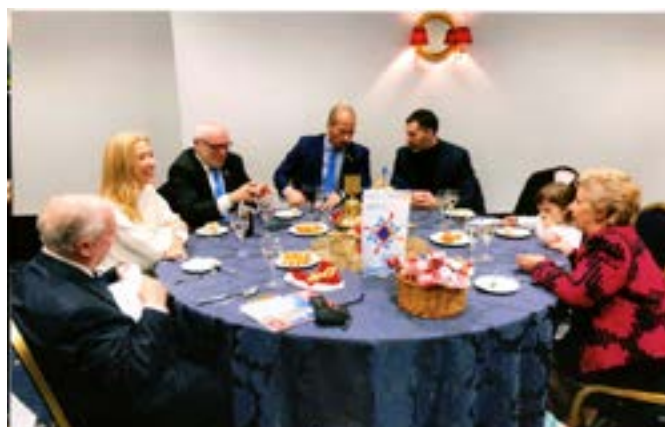
Mesa da Presidência.