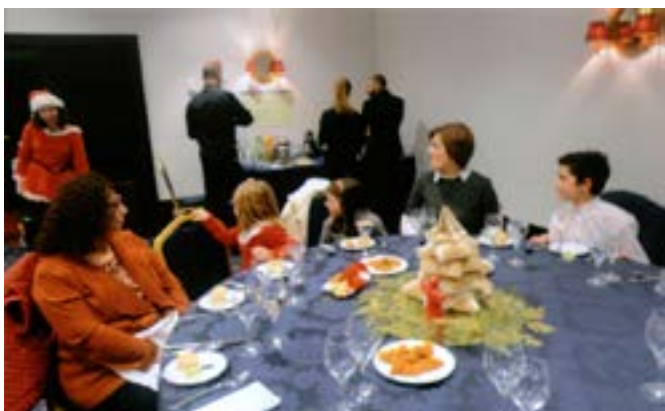
As gentes da Aldeia SOS.