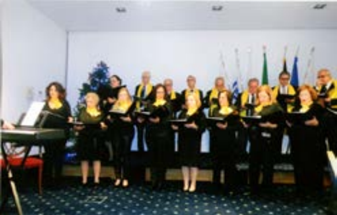
O nosso Grupo Coral actua com geral admiração!