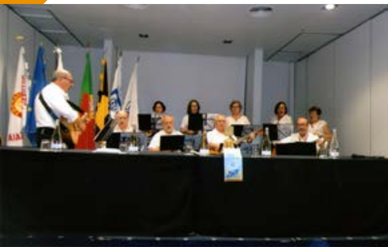
No momento musical actuam os elementos do Grupo de Violas e Cavaquinhos da Universidade Senior do Rotary em Matosinhos.