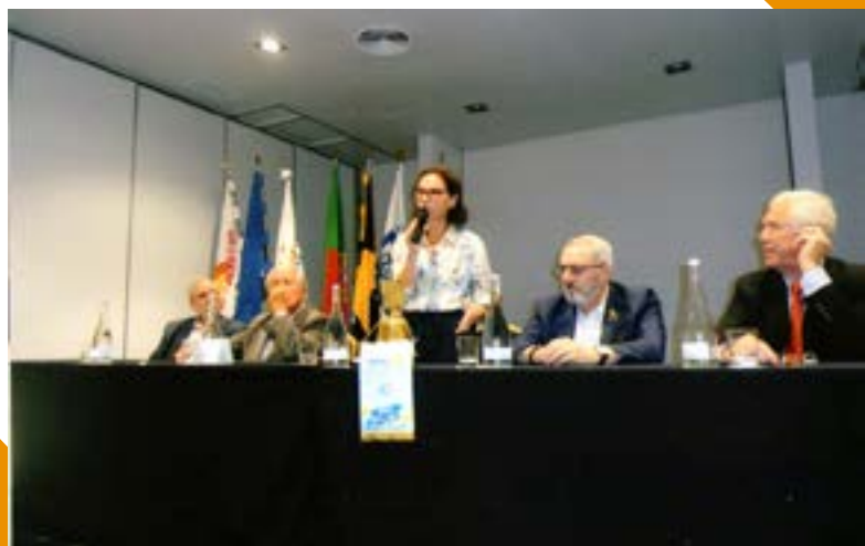
Nas palavras introdutórias, fala a nossa Presidente.