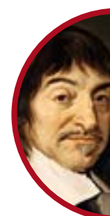
Gary Bettman (1952-...)

"Apenas desejo a tranquilidade e o descanso, que são os bens que os mais poderosos reis não podem conceder a quem os não pode tomar pelas suas próprias mãos."