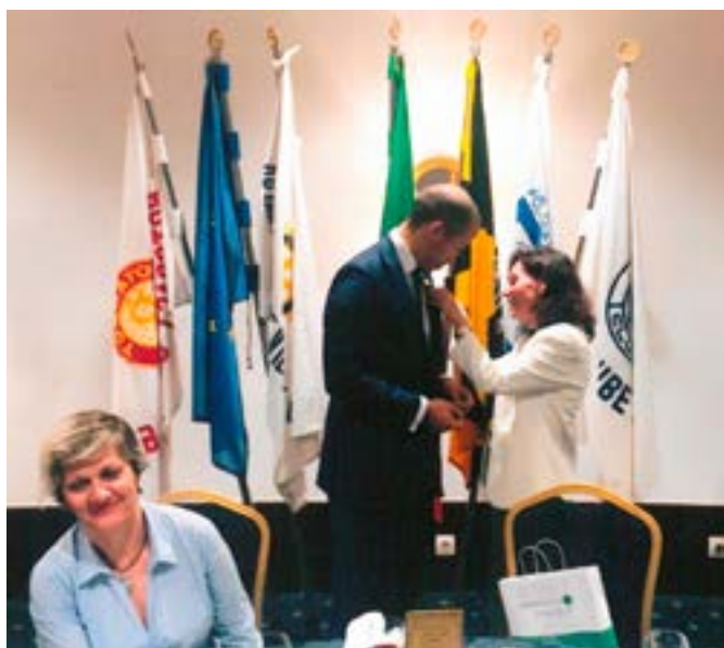
A Transmissão ela mesma!