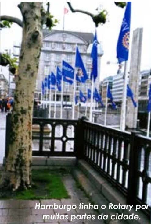
Hamburgo tinha o Rotary por muitas partes da cidade.

Fui com a Miita para Hamburgo, uma cidade do norte da Alemanha na qual já tínhamos estado e que é, além de muito mais, o terceiro maior porto da Europa. É banhada pela confluência dos rios Elba e Alster. Foi nela que se realizou a Convenção Anual do Rotary, agora a de 2019, e nela compareceram mais de 26.000 Rotários e convidados.