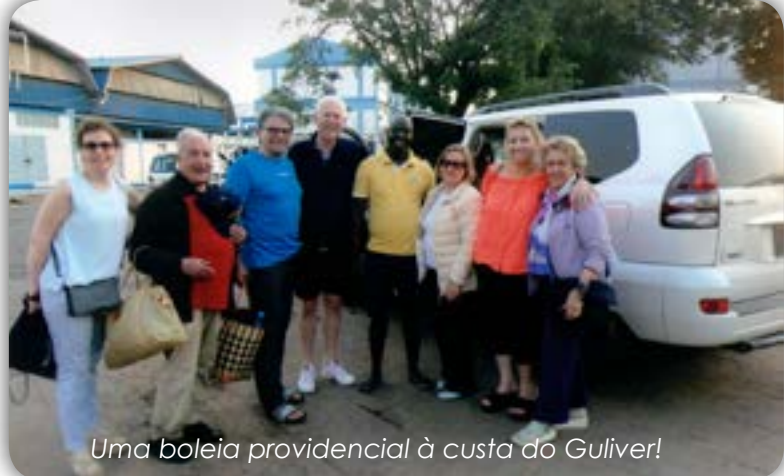
Uma boleia providencial à custa do Guliver!