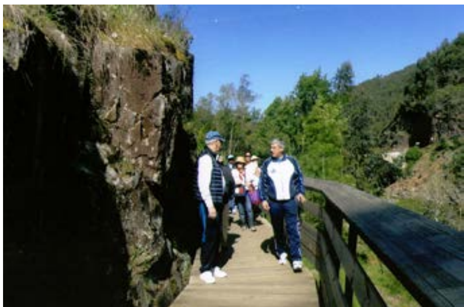
E lá vamos!

E lá fomos, divertidos, para Espiunca, onde começa a “aventura” dos passadiços do Paiva, uma obra de se lhe tirar o chapéu traçada numa