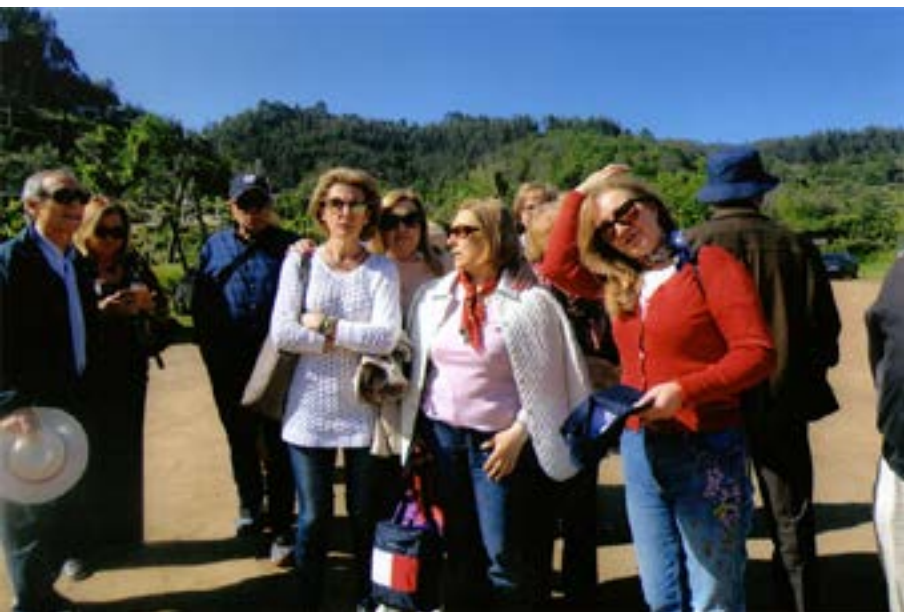
Prontos para arrancar...

moldura de paisagens de sonho. Neles percorremos de bom grado obra dos 5 kms. pois as vistas, o cenário, maravilhavam a cada volta. Terminámos a caminhada à vista da Praia do Vau e “esfolámos o rabo” com uma ladeira final aonde o carro nos foi apanhar para nos conduzir ao restaurante “Espinheiro”, numa casa de campo que só quem sabe permite atingir.