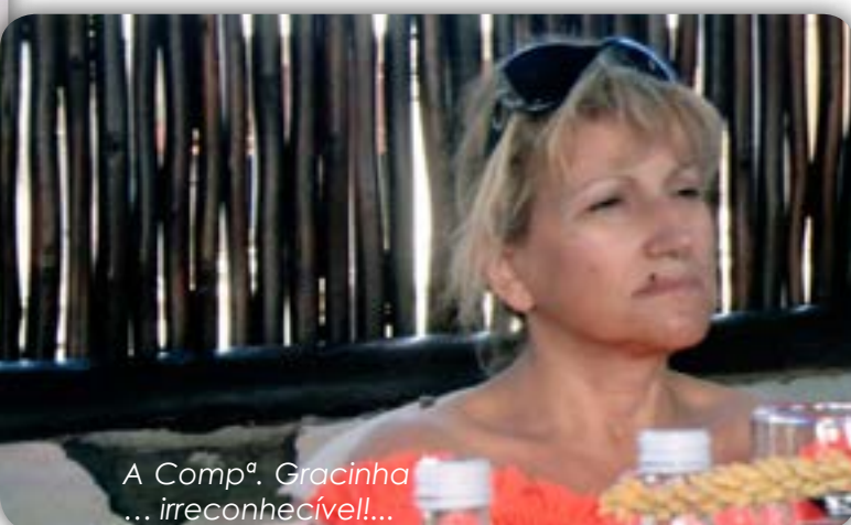
A Compª. Gracinha ... irreconhecível!...