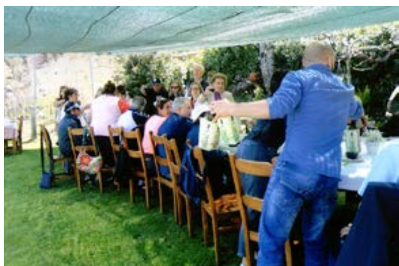
Um almoço reparador!

Depois, ala para a "Casa das Pedras Parideiras". Trata-se de um fenómeno geológico único em todo o mundo e, cumpre reconhecê-lo, está excelentemente exibido no local, ali junto da aldeia de Castanheira. Com acolhedoras instalações, ali é exibido um video de superior qualidade que tudo explica com absoluto rigor científico e imagens que ficam.