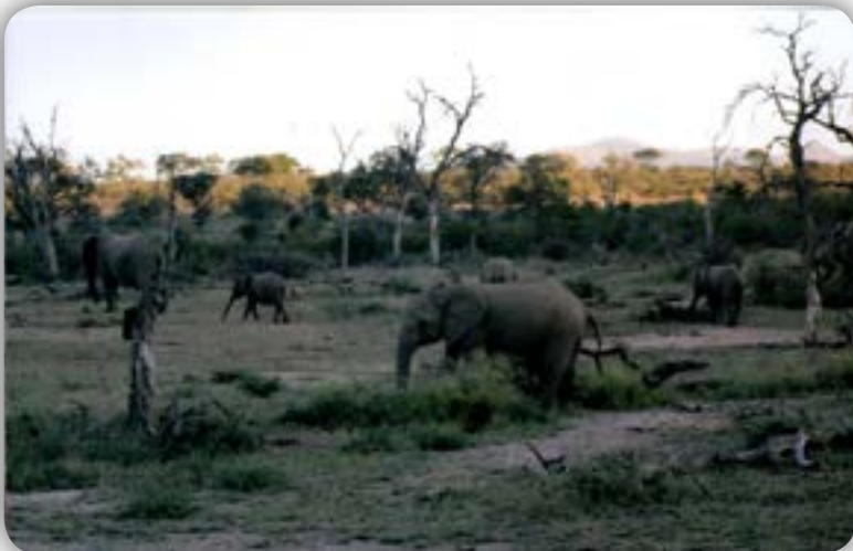
Claro que são elefantes!...