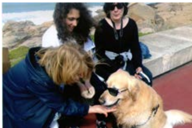
Até a cadela se associou à jornada!...