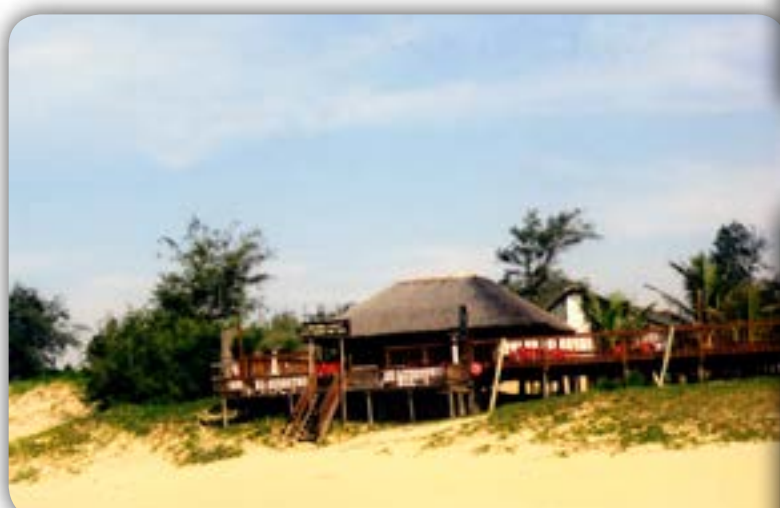
Estrutura na “Ponta do Ouro”.