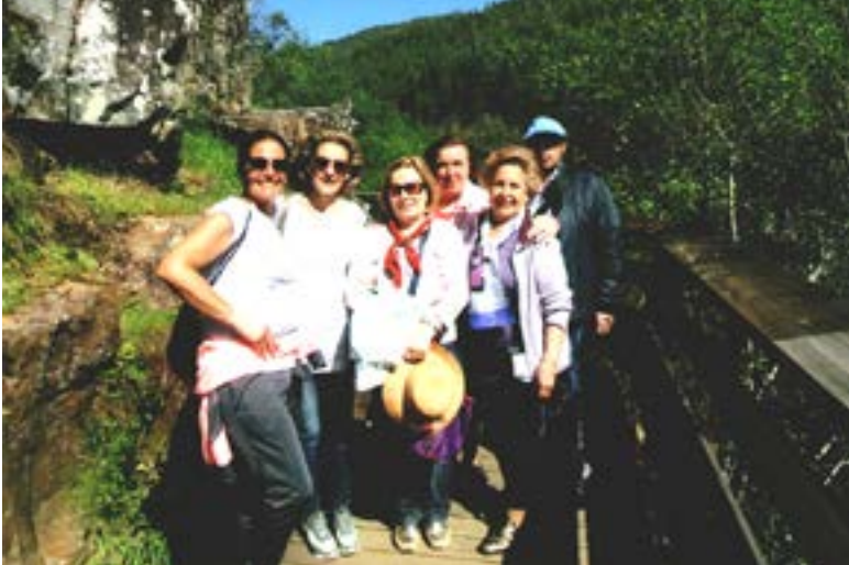
Numa pausa breve.