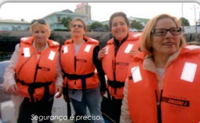
Segurança é preciso..