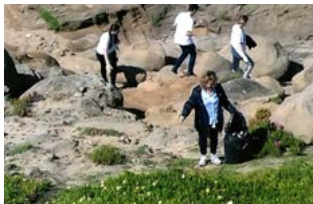
Ah, lixo, se te apanho!...