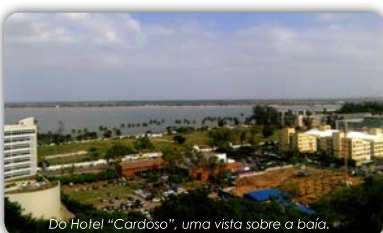
Do Hotel "Cardoso", uma vista sobre a baía.