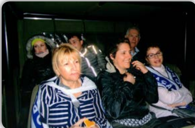
Safari na noite...