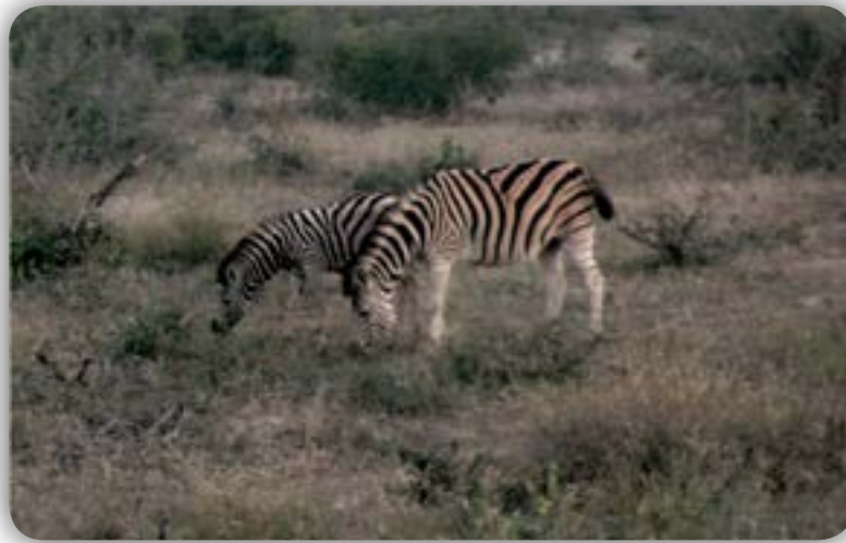
“Cavalos em pijama”.