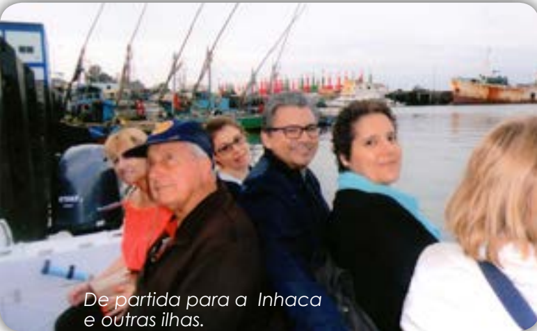
De partida para a Inhaca e outras ilhas.