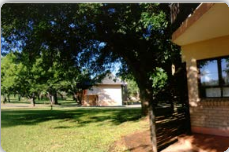
Um aspecto do “Kruger Park”.

E foi um grupo coeso e admiravelmente companheiro, disposto a fruir da jornada e imbuído de forte espírito de companheirismo rotário.