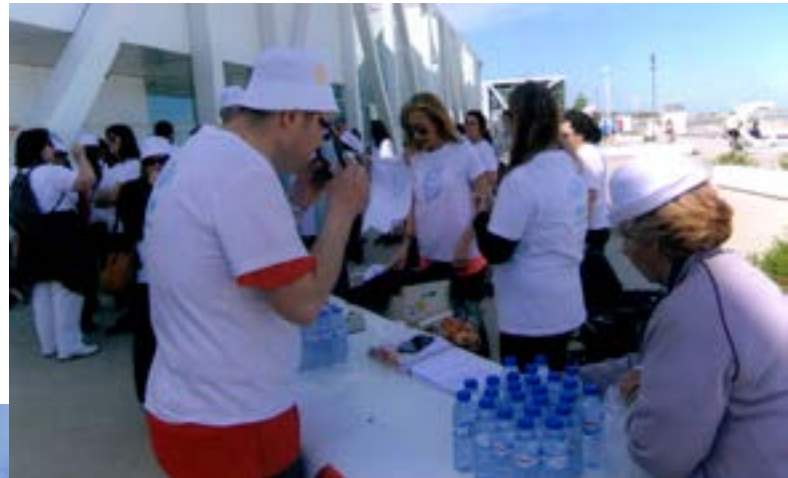
Os preparativos na mesa de inscrições.

Em organização da "Casa da Amizade", esta jornada beneficiou duma bela manhã de sol e decorreu no passado dia 7 de Maio. Pelas 10 horas, cerca de centena e meia de pessoas convergiram para a marina da Afurada a fim de participarem numa caminhada de uns bons 6 kms. ao longo da margem esquerda do Douro e prosseguindo pela orla marítima até um pouco mais além do Restaurante "Casa Branca", mais exactamente até às pedras amarelas, e regresso ao local da partida.