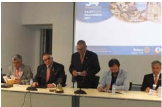
Fala o Gov. Ernesto Rodrigues.