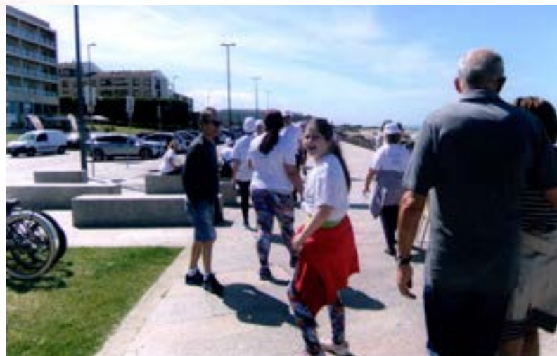
E ala ... que se faz tarde!

E foi assim, com bastante alegria e vontade de cumprir a exigente caminhada e gozar de magnífico sol e de belíssimas paisagens, que o numeroso pelotão, com toda a gente equipada a preceito, gozou uma bela manhã de saudável exercício físico num bem recomendável convívio por uma boa causa.