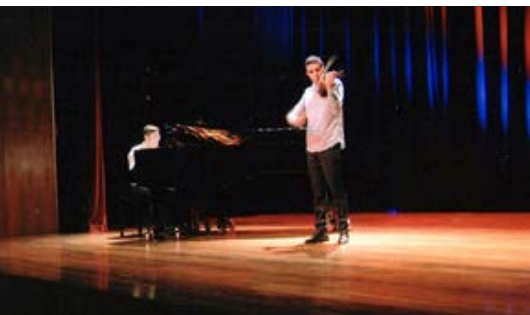
Um excelente Violinista.

O Concerto ofereceu um alargado leque de actuações e todas belíssimas, numa clara evidência da alta qualidade do ensino musical que a Academia assegura: houve danças de belíssimo recorte técnico e artístico, música em violino