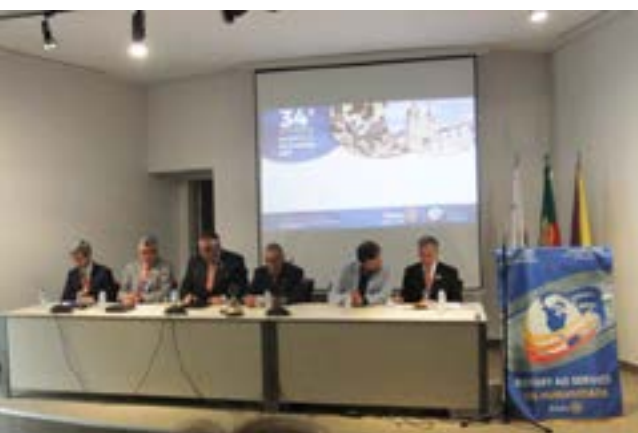
Na Sessão de Abertura.