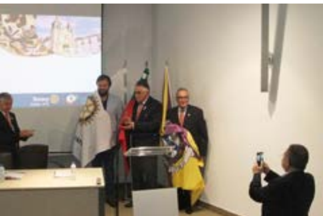
A Saudação às Bandeiras.