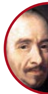
Dante Alighieri (1265-1321)

"É possível doar muito sem criar obrigações: a maneira de dar vale muito mais do que o donativo."