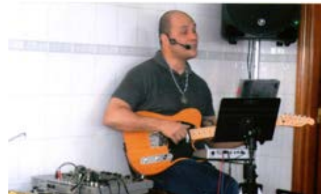
Animação musical da qualidade do Ilem.