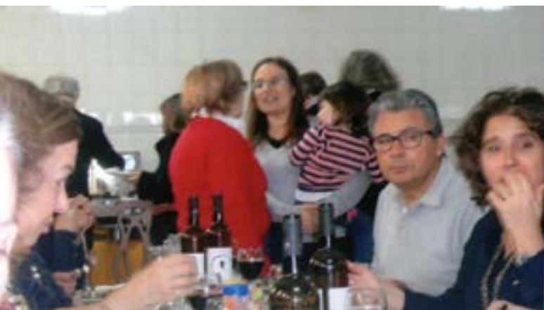
... e outro.