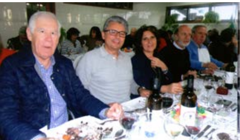
Um friso dos participantes...