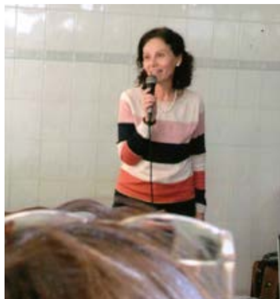
A Presidente Compº. Mercês felicita a "Casa da Amizade".