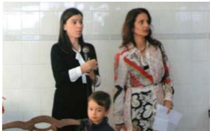
A Presidente da "Casa da Amizade", com o seu Dinis, espantada com o que por ali passou...