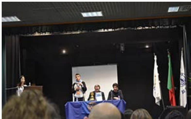
A mesa que presidiu às sessões de trabalho.