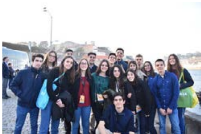
A formidável equipa do Interact Club ESAS/Vila Nova de Gaia.

Foi, pois, uma jornada muito proveitosa e de excelência para quantos a ela aderiram e pela qual está credor de calorosas felicitações o Interact Club ESAS/Vila Nova de Gaia. Assim é que é!