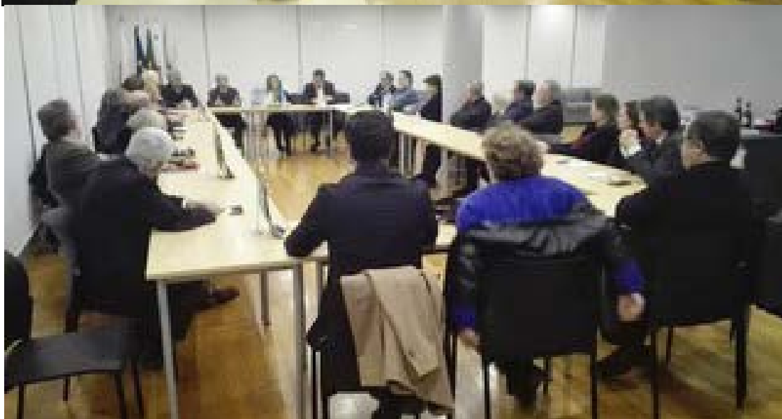
Dois aspectos da sala na qual a reunião decorreu.