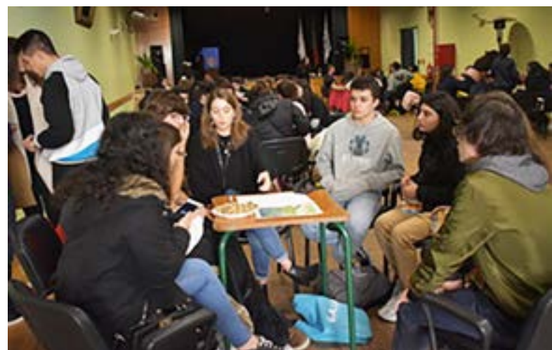
Numa das pausas de convívio.