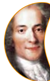
Albert Einstein (1879-1955)

"Um dia tudo será excelente, eis a nossa esperança; hoje tudo corre pelo melhor, eis a nossa ilusão".