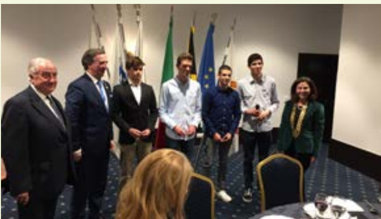
Mais Interactistas no Interact Club ESAS-Vila Nova de Gaia.