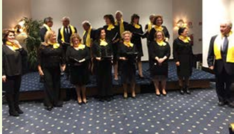
O nosso Grupo Coral exibiu-se a grande altura!