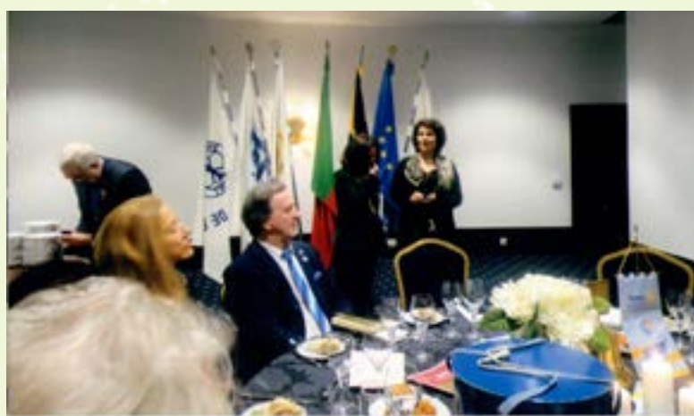
... assim como a Comp a . Inês...