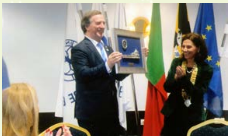
E um presente para o nosso Governador.