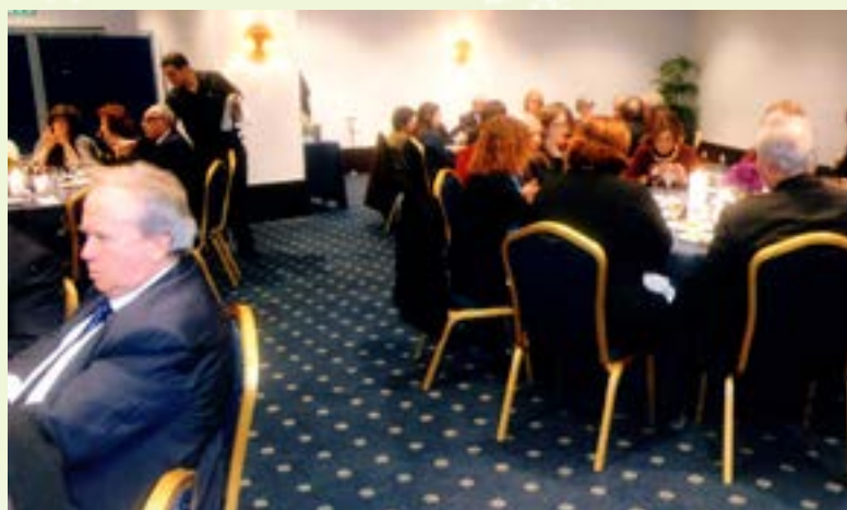
Aspecto parcial da sala.