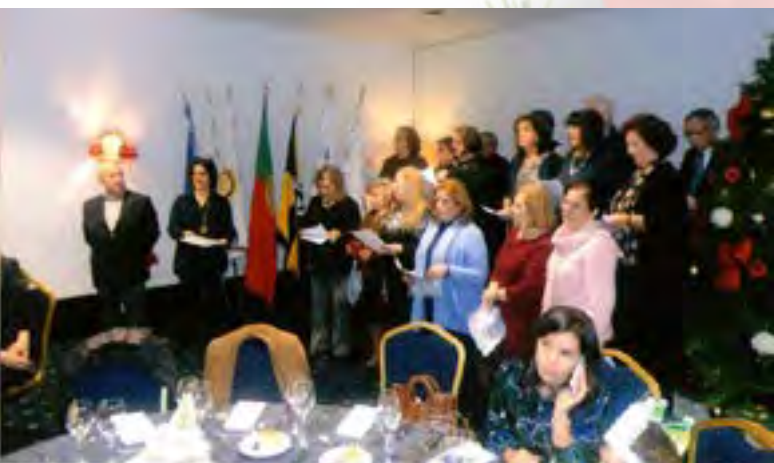
Apresentando o Grupo Coral.