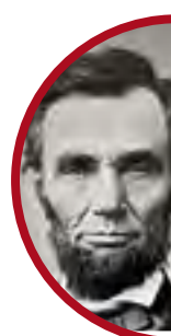
Gustave Le Bon (1841-1931)

"Pecar pelo silêncio, quando se deveria protestar, transforma homens em cobardes".