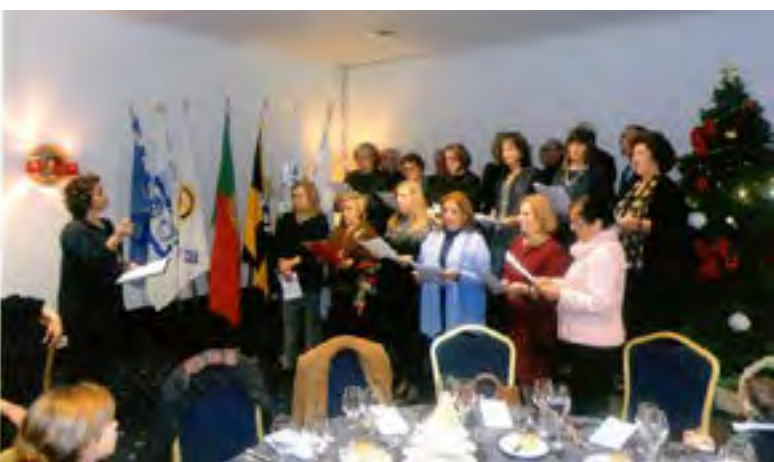
Uma memorável pre-apresentação do "Insuperável" Grupo Coral.

que a fez aumentando a expectativa. O Maestro titular não pode estar, por "amarrado" a outro compromisso. Mas assumiu a regência a Comp a . Inês e com uma autoridade e competência absolutamente notáveis. E recusando servir-se da batuta! O Grupo Coral do Clube entoou duas melodias apenas, mas, reconheça-se, com enorme disciplina e não menor qualidade. E apenas após cerca de um mês e com ensaios uni-semanais! Melhor?! Qual Michael Jackson, qual cabaça!!!