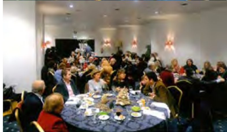
Aspectos gerais da sala.