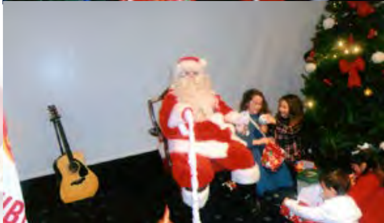
E chegou o Pai Natal!!